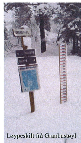
Løypeskilt frå Granbustøyl

Auke tilskot til driftsstøtte til oppkøyring av løyper, som pr. i dag er kr 50.000 for heile kommunen