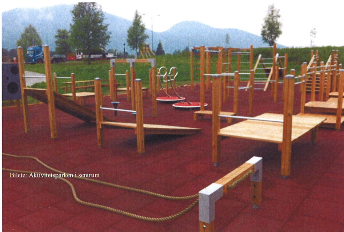
Bilete: Aktivitetsparken i sentrum

Treningsapparat for vaksne er sett opp rett aust for Sparbutikken i sentrum, apparata er tenkt nytta som ein uformell arena for vaksne å kunne trene ute på.