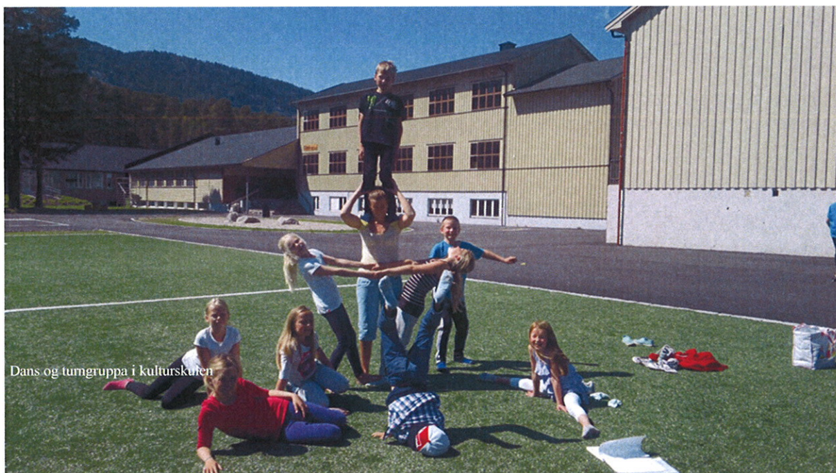
Dans og tumgrupper i kulturskolen