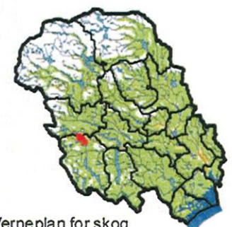
Verneplan for skog Telemark fylke